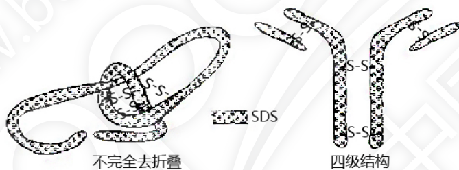
图 3. SDS 和非还原处理的蛋白 [1]

许多样品，如生理体液、血清或尿素，一般只需用 1% SDS 在 100°C 煮 3 分钟，并不需要加还原试剂，此时二硫键不能被断裂，蛋白并没有完全被去折叠（见图 3）。因为在这样的实验中并不希望破坏免疫球蛋白的四级结构而得到分离，所以不能用此方法来测定分子量。